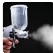
降解挥发性有机化合物 (VOCs) 和其他有机化合物