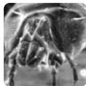
消除空气中及物表上的 微生物